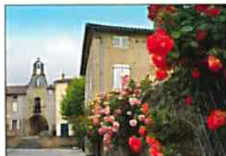
Camon, le village des roses