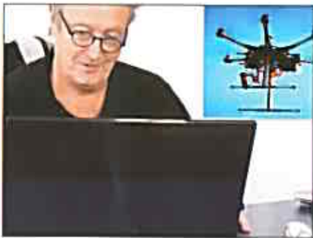
Drones&Co veut conquérir les marchés émergents.

Les allègements fiscaux consentis du fait que Mirepoix est dans le périmètre d'un BER (traduisez : bassin d'emploi à redynamiser) n'y sont pas pour rien, non plus. Drones&Co est au cœur de Mirepoix depuis octobre 2013. La start-up Freemindtronic a