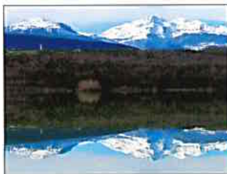
Reflet du massif de Tabre sur le lac de Montbel

Avec la fusion des deux communautés, le Pays de Mirepoix intègre désormais les sites de Vals et de Tabariane, de nouveaux fleurons patrimoniaux. Plus largement, chaque village, chaque effort associatif et privé, peuvent contribuer à faire de notre pays une destination touristique à part entière. Car telle est l'ambition politique, et l'objectif qui doit être partagé par tous les acteurs. L'Office du Tourisme se positionne comme un fédérateur de toutes les initiatives qui contribueront à progresser dans ce sens. Il veut, sur l'ensemble du territoire, et au-delà, dans le cadre du Pays des Pyrénées Cathares, promouvoir la complémentarité des sites et des animations, avec une volonté de qualité. Un nouveau logo, des labels précieux, un développement de l'e-tourisme, côté communication, voilà le projet sur de bons rails.